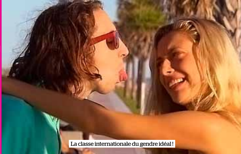
La classe internationale du genre idéal !